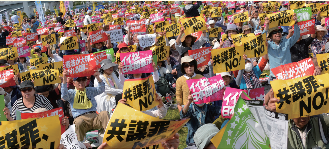
2017年「施行70年、いいネ！日本国憲法5・3集会」5万5000人参加（東京・有明防災公園）

“安倍9条改憲”反対の一点で手をつなぎましょう。3000万人の「戦争はイヤだ」の声を集めて、9条を未来につないでいきましょう。